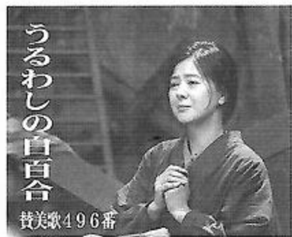
うるわしの白百合 賛美歌496番